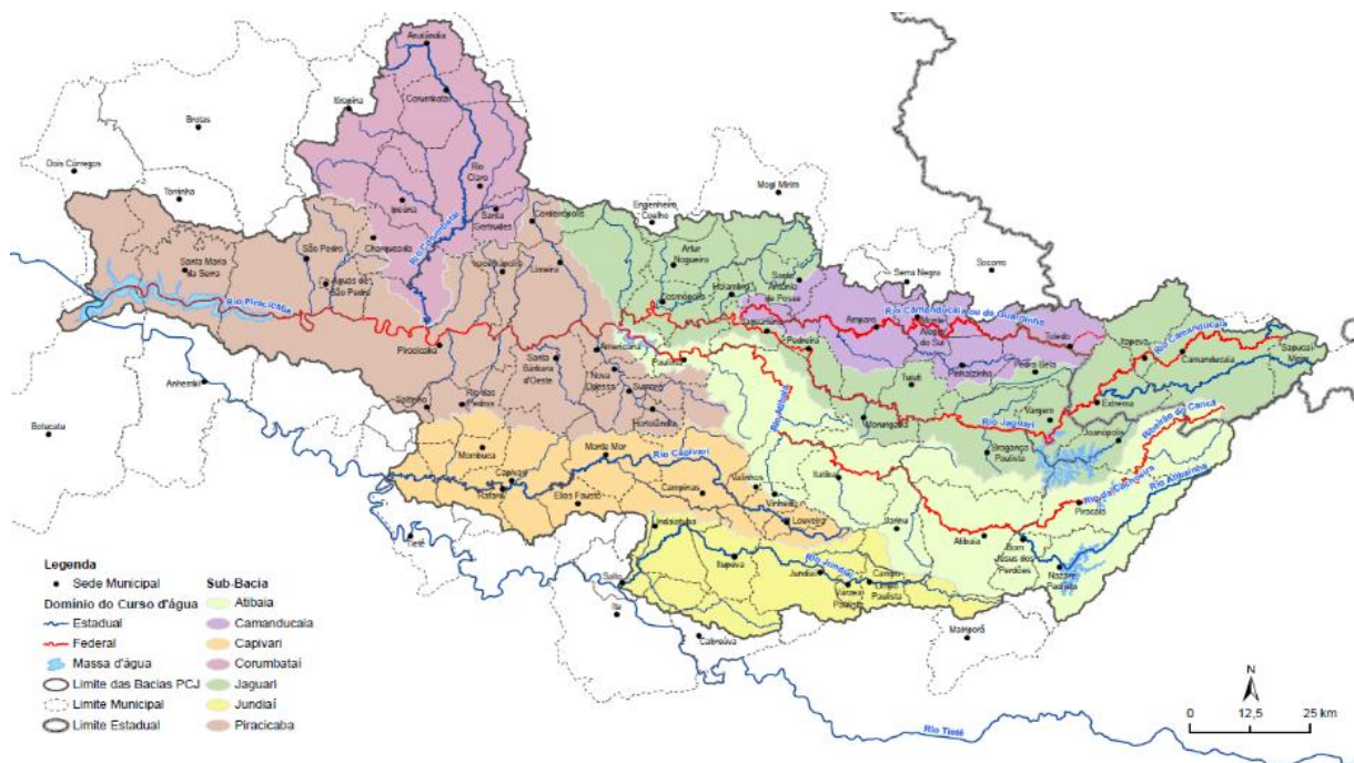
Figura 2. Bacias Hidrográficas dos rios Piracicaba, Capivari e Jundiá (Bacias PCJ)