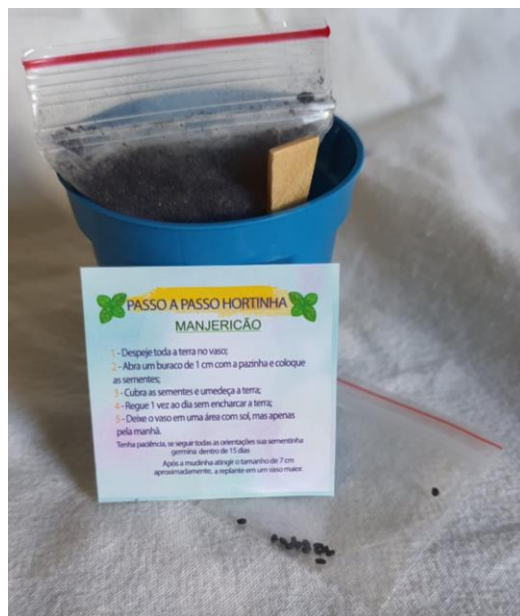
Kit personalizado (mini vaso e semente para plantar).

Dia Mundial do Meio Ambiente – Junho 2022 com incentivo a participação do evento realizado no município de Piracicaba/SP ( SIMAPIRA ) e entrega de um kit personalizado (mini vaso e semente para plantar).