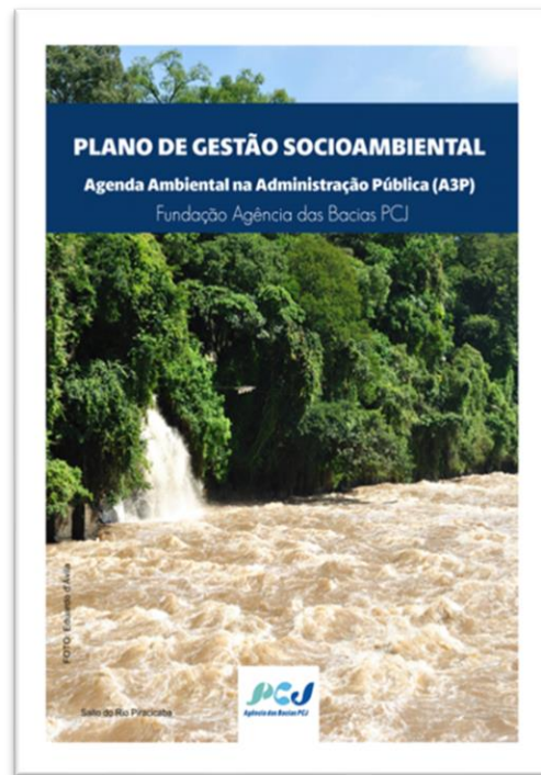
PGS 1ª Edição