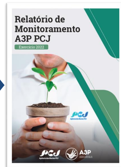
RELATÓRIO DE MONITORAMENTO A3P PCJ - EXERCÍCIO 2022