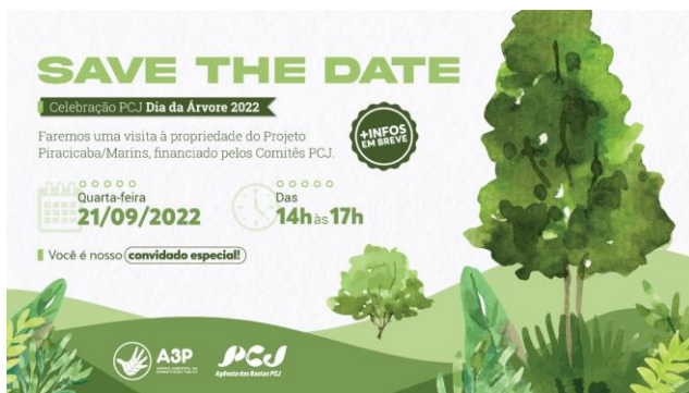
Convite de participação Dia da Árvore 2022.

O Dia da Árvore 2022 foi comemorado com uma visita de campo a uma das propriedades do Projeto Piracicaba/Marins (apoio da Cobrança PCJ) e foi finalizado com um plantio simbólico.