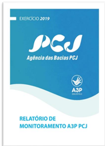
RELATÓRIO DE MONITORAMENTO A3P PCJ - EXERCÍCIO 2019