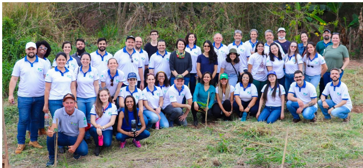
Colaboradores no plantio simbólico em comemoração ao Dia da Árvore.