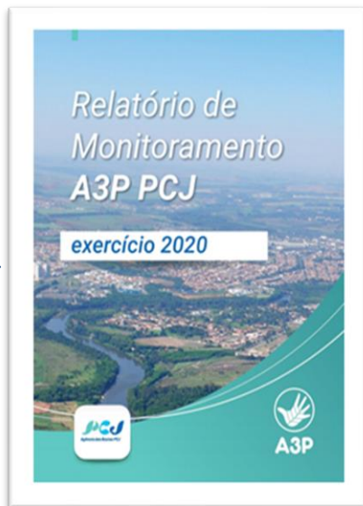
RELATÓRIO DE MONITORAMENTO A3P PCJ - EXERCÍCIO 2020