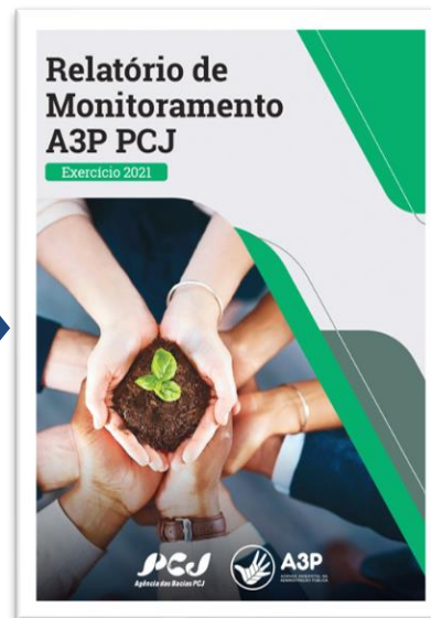
RELATÓRIO DE MONITORAMENTO A3P PCJ - EXERCÍCIO 2021