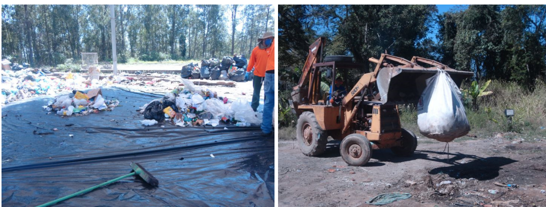
Figura 7 - Quarteamento e seleção de amostragem homogeneizada.