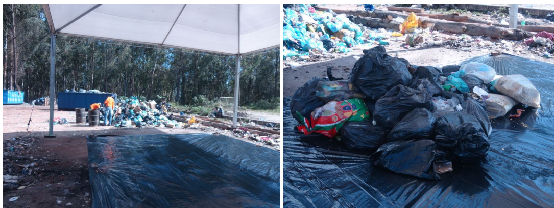
Figura 3 - Coleta de resíduos realizada pelos caminhões compactadores e seleção de amostra inicial.