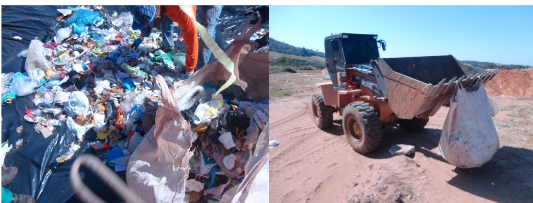
Figura 8 - Quarteamento e seleção de amostragem homogeneizada.