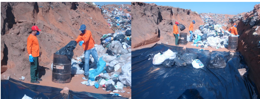
Figura 4 - Coleta de resíduos realizada pelos caminhões compactadores e seleção de amostra inicial.