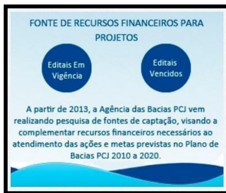
Figura 2 - Banner de acesso às fontes de recursos mapeados e disponibilizados

Quanto às divulgações, os procedimentos são os seguintes: