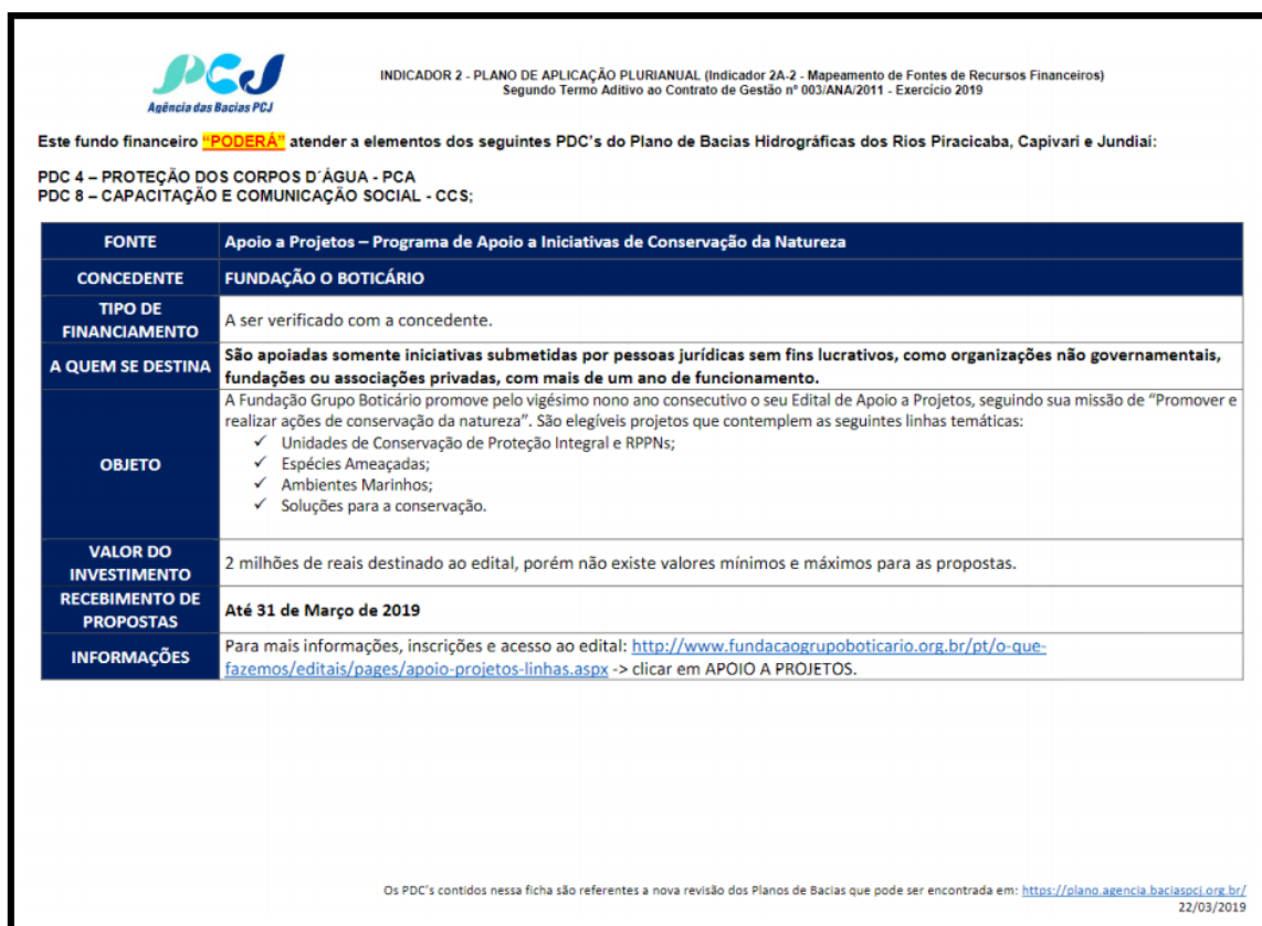
Figura 1 - Exemplo de ficha publicado para divulgação dos recursos disponíveis:

As fichas publicadas poderão ser acessadas através do banner, conforme a Figura 2 disponível no site da AGÊNCIA DAS BACIAS PCJ: