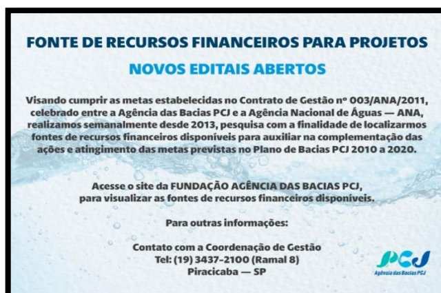
Figura 3 – Banner usado para a divulgação das fontes publicadas