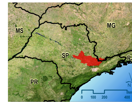
Localização da Bacia do PCJ