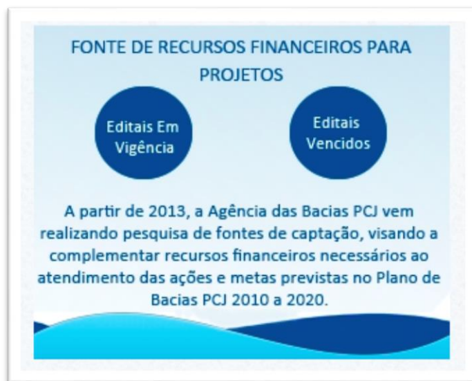
Figura 1: link de acesso as fontes de recursos mapeados e disponibilizados no site da Agência das Bacias PCJ:

http://www.agenciapcj.org.br/novo/component/content/article/8-institucional/298-fontes-recursos