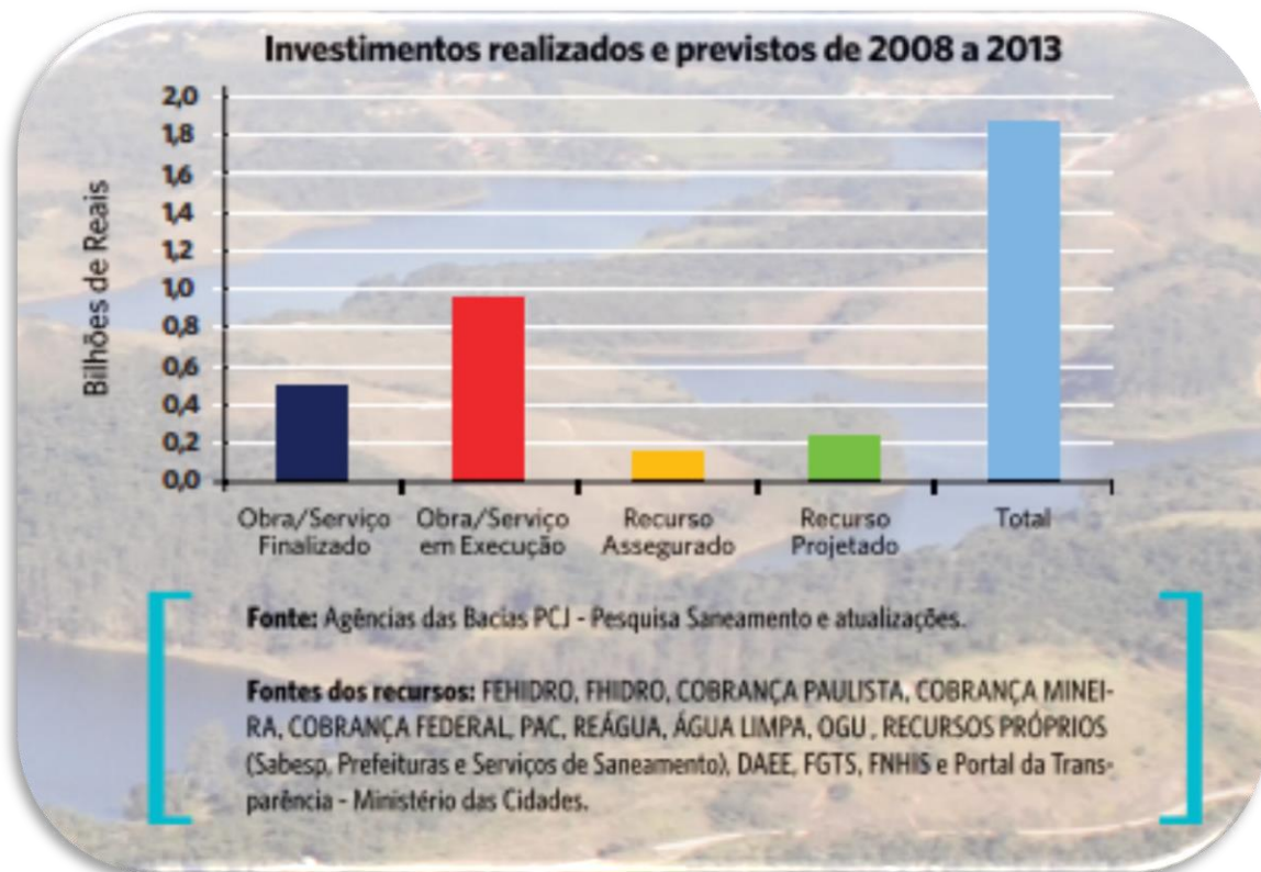
Gráfico1: Investimentos realizados e previstos de 2008 a 2013:

http://www.agenciapcj.org.br/fotos/folder-20anos.pdf